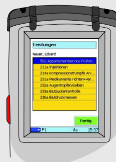
Leistungen je Kunde