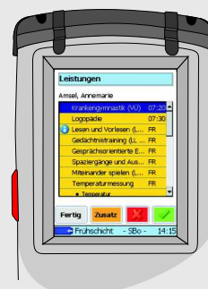
Leistungen je Bewohner