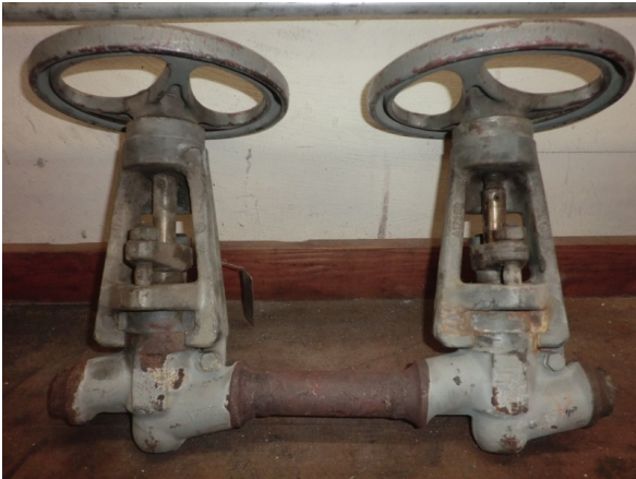
KSB-Absperrarmatur PN320 vorher