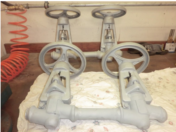
KSB-Absperrarmatur PN320 nachher (generalüberholt)