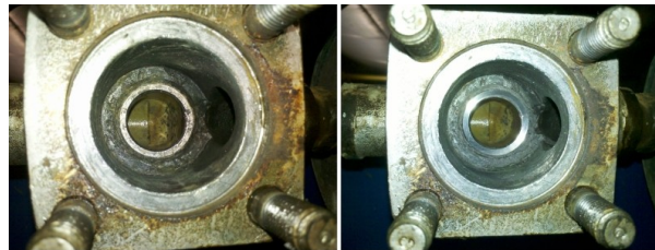
ARI-Absperrarmatur vor und nach dem Einschleifen vor Ort.

Im oben gezeigten Fall wurde vom Kunden eine mechanische Hubbegrenzung für den pneumatischen Stellantrieb benötigt. Der Antrieb kann durch unseren Umbau beliebig im Bereich von 0-35% blockiert werden.