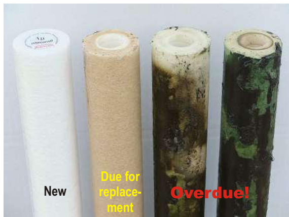
Fig.1: Depth filter 1µ.

Timely replacement of filters is a basic prerequisite for the correct function of any water treatment. Trivial? That's what we thought, too. The following pictures show (left to right) one new filter, one in commonly polluted condition due for replacement, and one extremely dirty and algae contaminated example that should have been replaced a long time ago. Our technical service team is regularly confronted with systems neglected to such an extent. Anyone can imagine the consequences for a subsequent high pressure system.