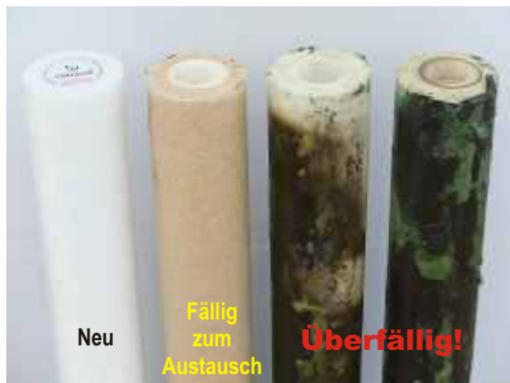
Abb.1: Tiefenfilter 1µ.

Der rechtzeitige Austausch der Filter ist die Grundvoraussetzung für das Funktionieren jeder Wasseraufbereitung. Banal? Das dachten wir auch. Die folgenden Abbildungen zeigen jeweils (von links nach rechts) einen neuen Filter, ein normal verschmutztes Exemplar, das ausgetauscht werden sollte, sowie extrem verdreckte und veralgte Filter, die längst hätten ausgetauscht werden müssen. Unser Kundendienst ist regelmäßig mit derart vernachlässigten Anlagen konfrontiert. Die Auswirkungen auf die nachfolgenden Hochdrucksysteme kann sich jeder ausmalen.